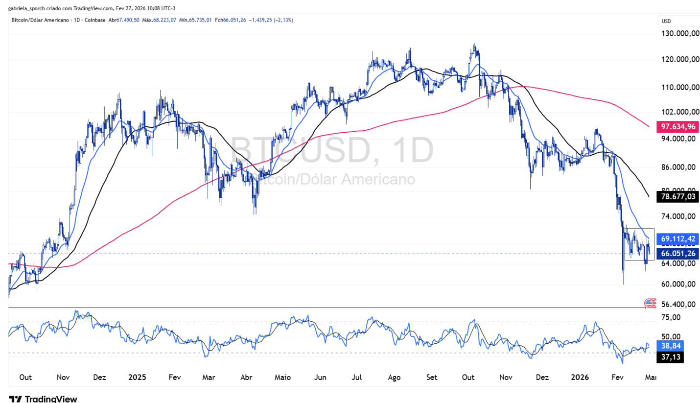
Figura 1 – BTCUSD (gráfico diário)