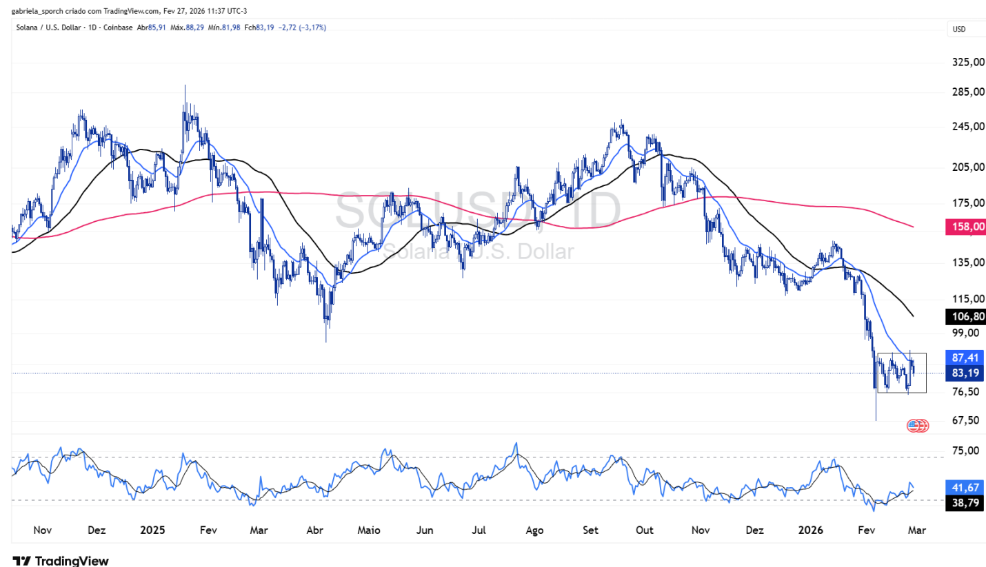
Figura 2 – SOLUSD (gráfico diário)