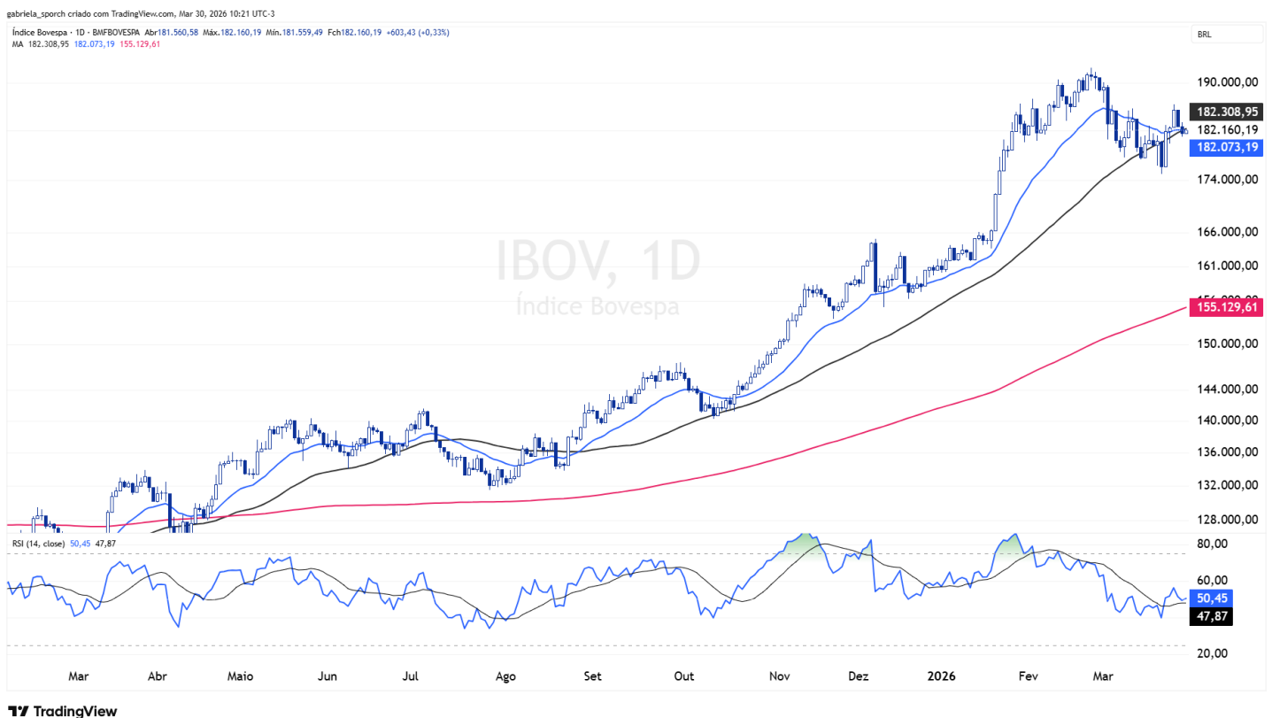
Figura 2 – IBOV (diário)

Insight: O cenário de curto prazo passa a ser de lateralização, com viés construtivo, condicionado à manutenção da média móvel de 50 dias como suporte. A sustentação acima desse nível tende a favorecer uma retomada gradual do movimento de alta, enquanto a perda pode alterar a dinâmica para um ajuste mais profundo.