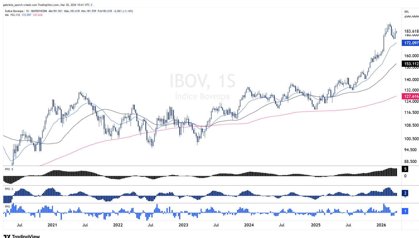
Figura 1 – IBOV – Keller Trend Model (semanal)