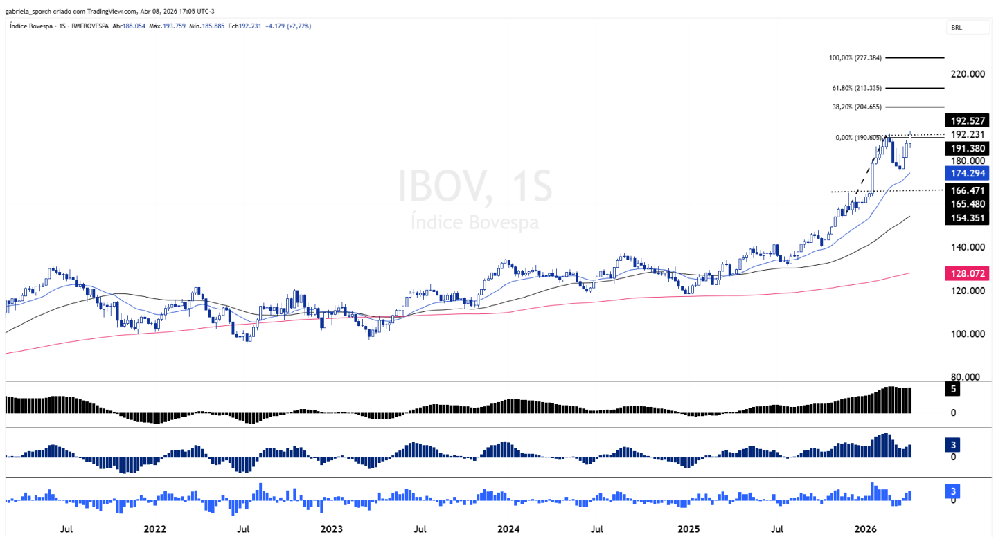
Figura 1 – IBOV – Keller Trend Model (semanal)