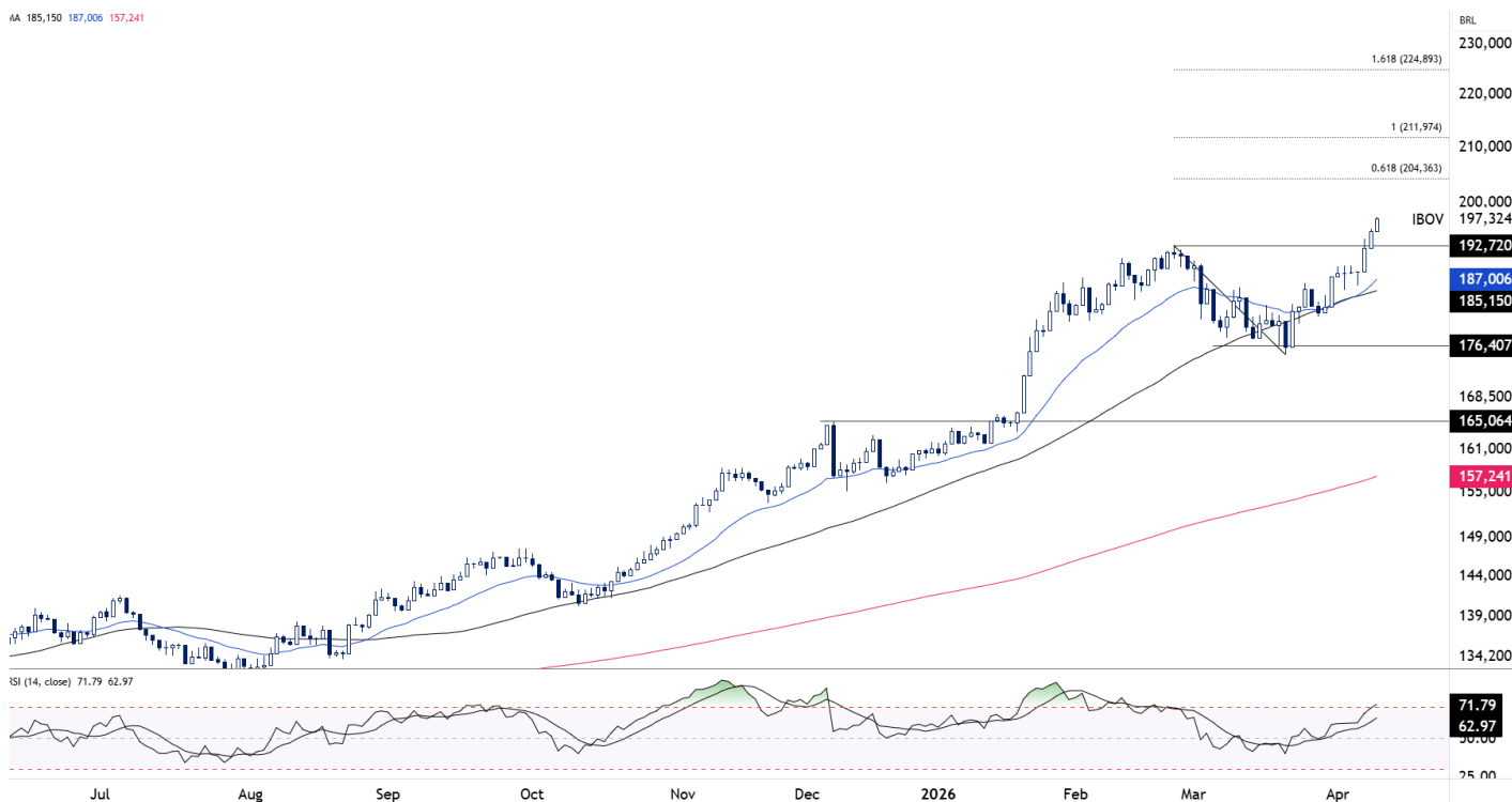
Figura 1 – IBOV (diário)

Os próximos suportes são a média móvel de 50 dias, em 185.150, segue como principal nível de defesa no curto prazo, seguida pelo fundo anterior em 177.165. A sustentação acima dessas regiões é importante para a continuidade do cenário de alta.