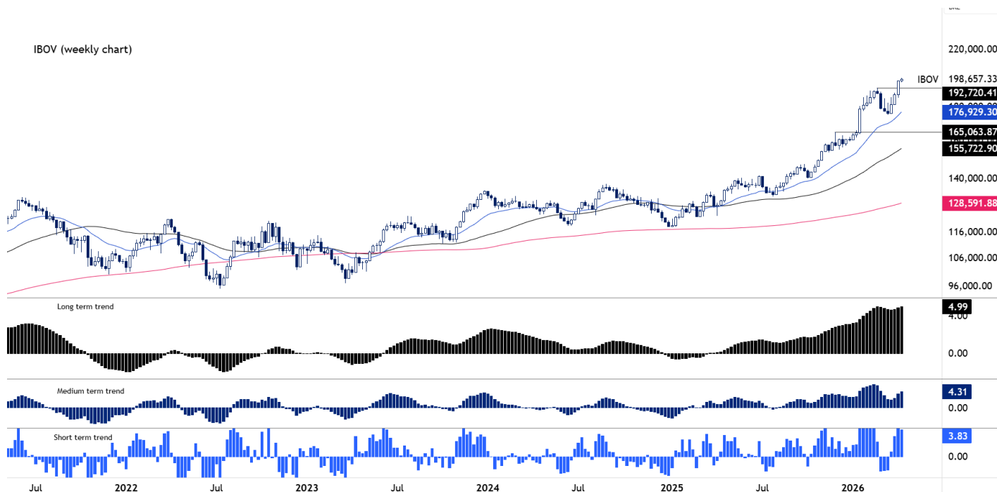
Figura 1 – IBOV (semanal)

Do ponto de vista técnico, o principal suporte passa a ser o fundo anterior em 175.500, nível que deve atuar como zona de defesa em eventuais movimentos de correção. A manutenção acima desse patamar é importante para preservar a estrutura da tendência.