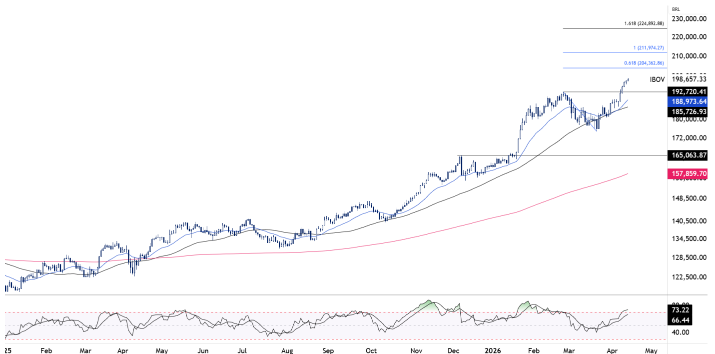
Figura 2 – IBOV (diário)

O Índice de Força Relativa (IFR) entrou em patamar de sobrecompra, indicando um mercado mais esticado após o movimento recente. Ainda assim, não observamos, por ora, sinais técnicos relevantes que indiquem reversão da tendência de alta no curto prazo.