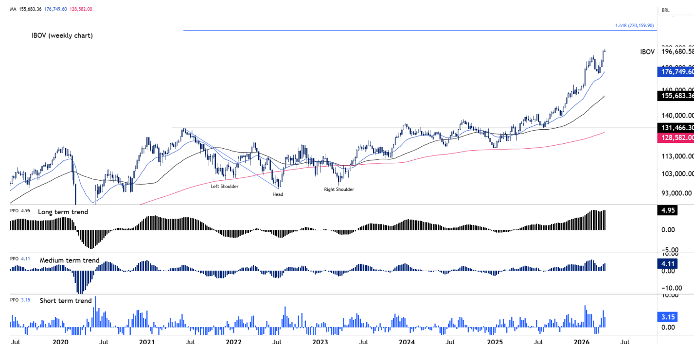
Figura 1 – IBOV (semanal)

O próximo suporte é o fundo anterior em 175.500, formado em 16-mar, que deve atuar como zona de defesa em eventuais correções. O price action mostra uma figura de reversão de “ombro-cabeça-ombro invertido”, formada entre nov-21 e mar-23, caracterizada por três fundos, sendo o central mais profundo (cabeça) e os laterais mais elevados (ombros), indicando transição de tendência de baixa para alta. A projeção técnica dessa formação aponta para a região dos 220.000 (projeção de 161,8%) como próxima resistência de médio prazo.