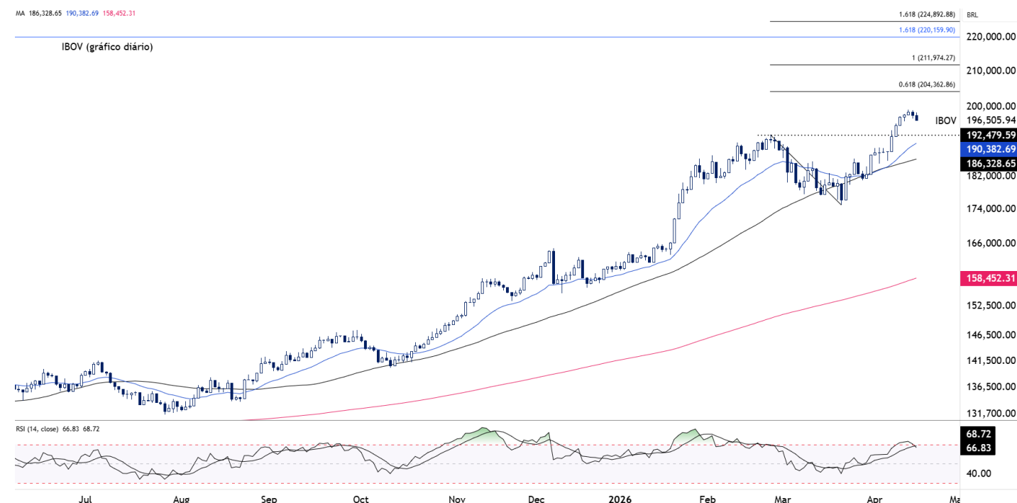
Figura 2 – IBOV (diário)

O price action dos últimos pregões mostra alguma perda de momentum, com destaque para o rompimento da mínima de 14-abr. Ainda assim, não identificamos vetores técnicos fortes o suficiente para caracterizar uma reversão da tendência no curto prazo.