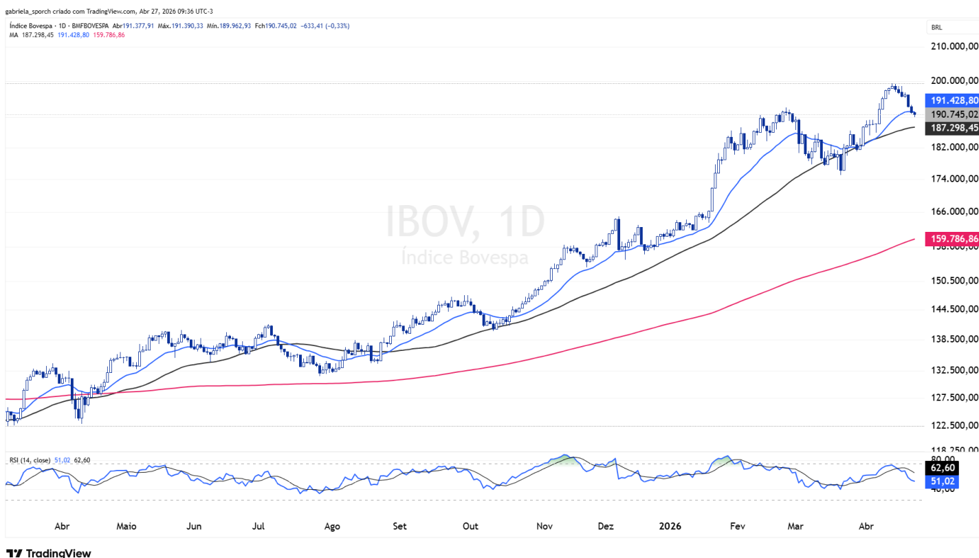
Figura 2 – IBOV (diário)

Para retomar o movimento de alta, o índice precisa voltar a trabalhar acima das resistências em 200.210 e 204.715 pontos. A superação dessas regiões indicaria recomposição da pressão compradora e poderia levar à formação de um novo pivô de alta no curto prazo.