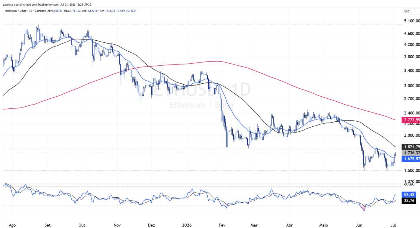
Figura 4 – ETHUSD (gráfico diário)