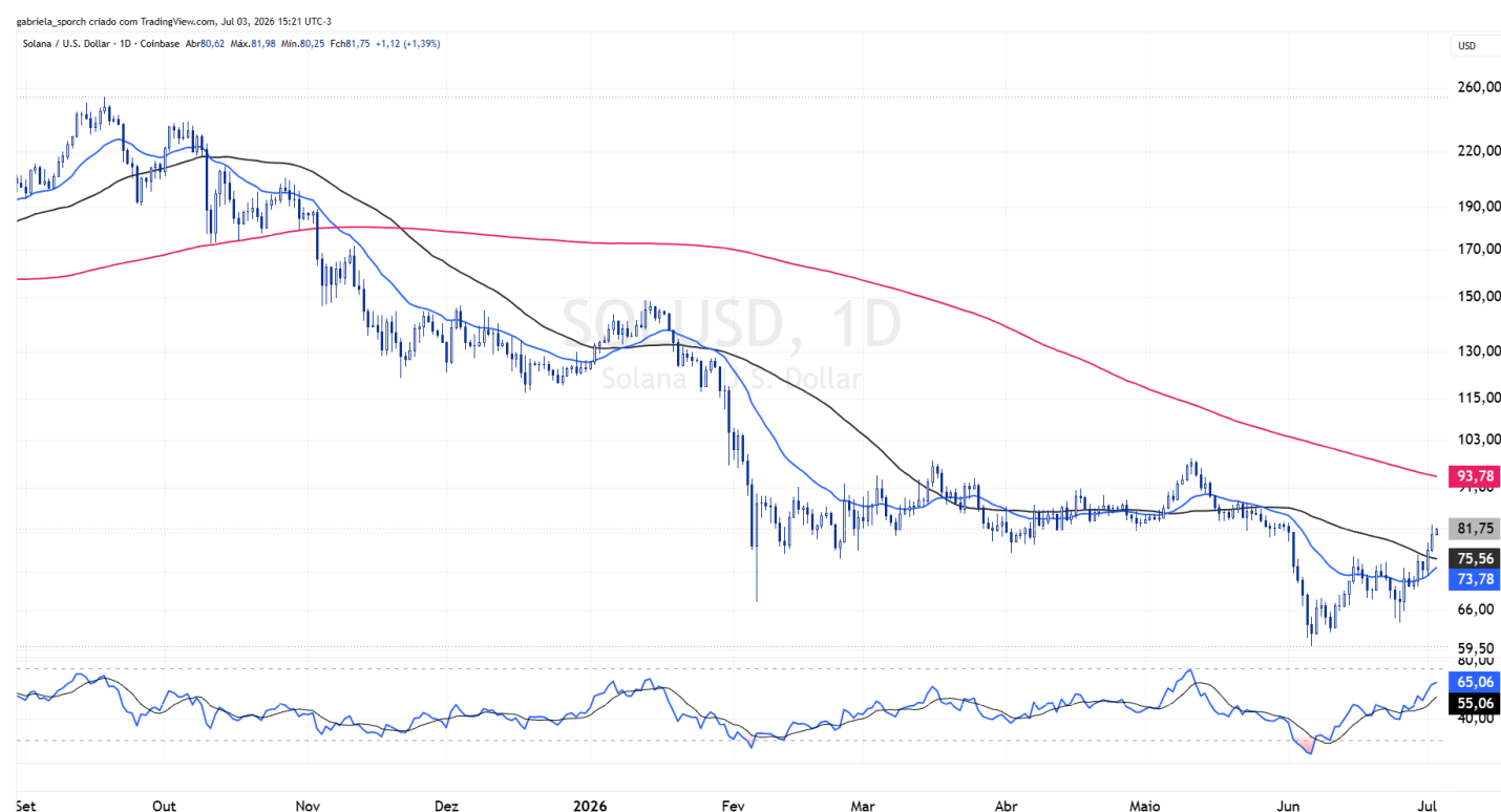
Figura 3 – SOLUSD (gráfico diário)